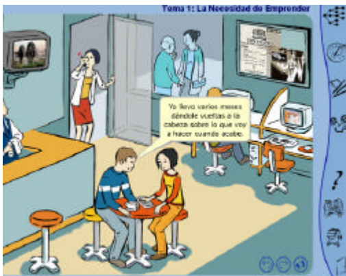
Imagen que representa la interface del MEM: UNIOVI - Emprende y en la que se pueden visualizar los iconos referidos a los distintos recursos del material para los que hemos utilizado los medias mencionados.

Utilizamos secuencias de video integrado en el MEM que se presenta en soporte digital. Este media nos ayuda a explicar fenómenos, procesos... así como, también, nos ayuda a reproducir imágenes en movimiento para informar sobre situaciones reales. Además, va acompañado de otros media como texto y audio que facilitan la comprensión y memorización de dichos procesos y aportan un mayor grado de significatividad al aprendizaje. En cuanto a las consideraciones tecnológicas de este media, debemos tener en cuenta cómo es la situación actual del video, su calidad, el tamaño que puede utilizarse (generalmente pequeño) y su capacidad de compresión.