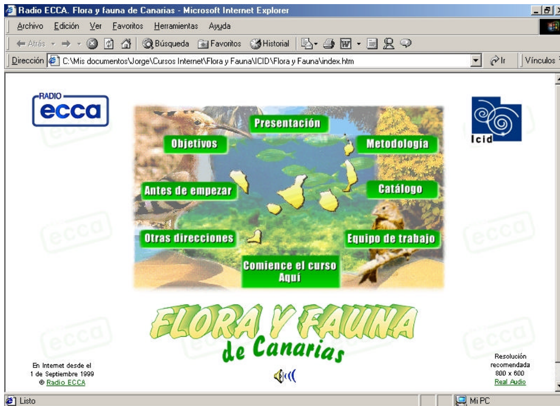
Flora y fauna de Canarias disponible en www.radioecca.org

El 15 de febrero de 2001, esta institución – junto con la ULPGC (Universidad de Las Palmas de Gran Canaria) y dentro del entorno IVA – puso en marcha su proyecto más ambicioso hasta el momento: Comunícate , un nuevo método de Español para extranjeros, que supuso nuestra primera experiencia de formación totalmente on-line .