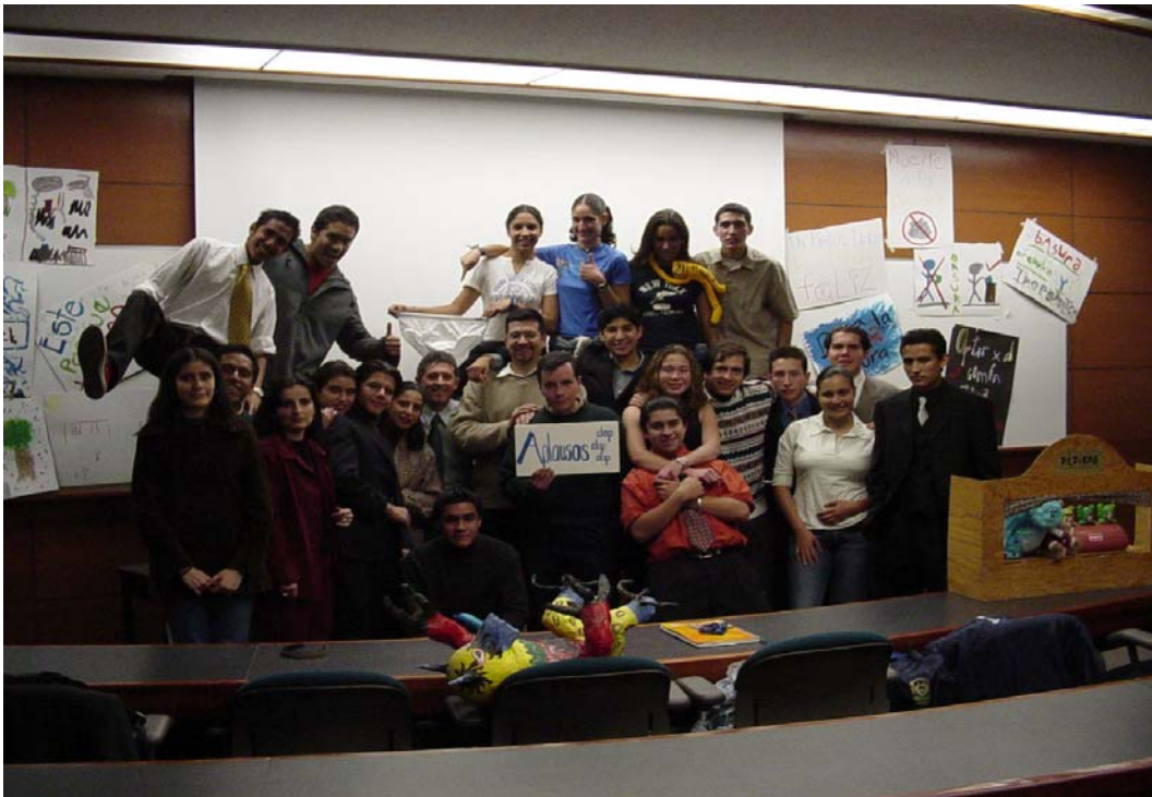
Todos los integrantes del equipo – alumnos y profesores- el día de la evaluación final.

de las mascararas, como dinámica de acercamiento a los Grandes Retos de la Humanidad, en la parte del Hombre, corporal, psicológico y espiritual. Esta dinámica está basada en la lectura Las máscaras del escritor mexicano y premio Nobel Octavio Paz.