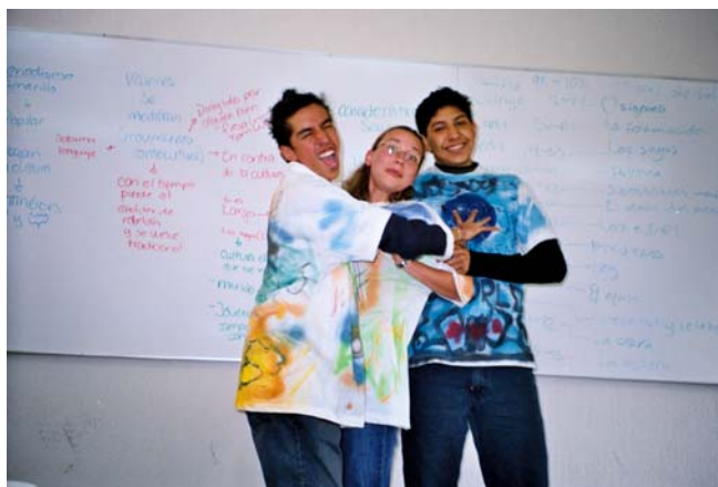
Alumnos realizando una dinámica relacionada con el Reto de la Humanidad “La Persona”