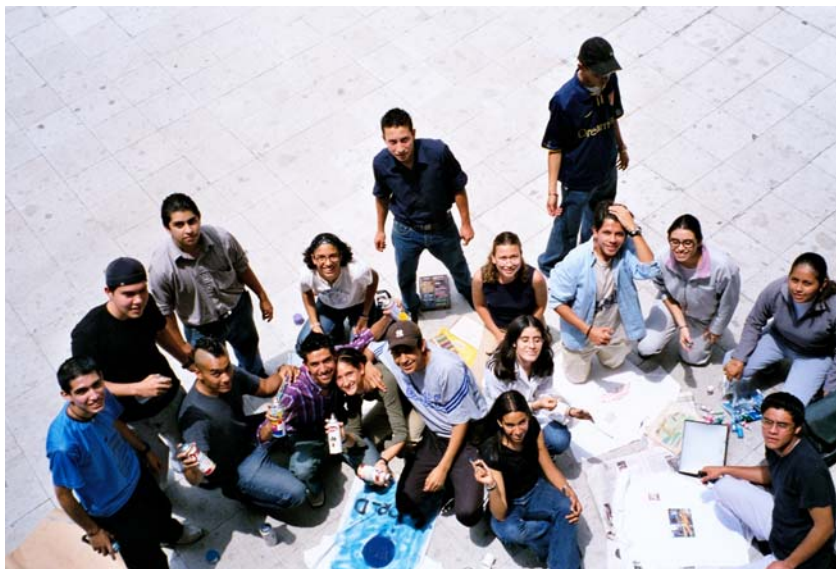
Todos los alumnos realizando una dinámica relacionada con el Reto de la Humanidad “La Persona”