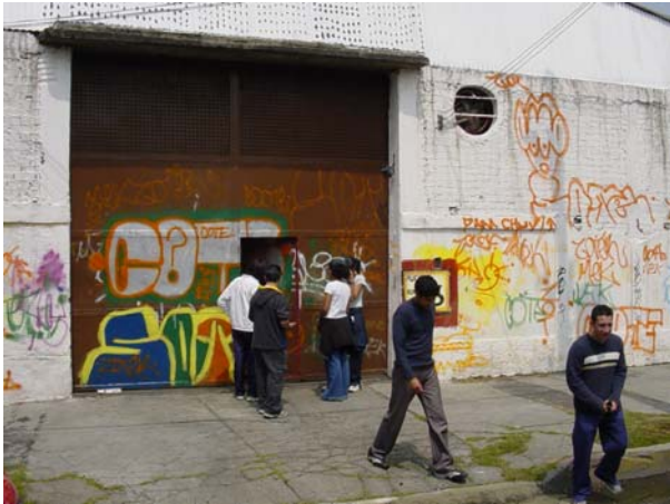
Varios alumnos tratando de entrar el depósito de reciclado de basura, en el cual nunca reconocieron que fuera.

Uno de los dos equipos en los que se dividió la primer visita de acercamiento a los Grandes Retos de La Humanidad en una visita a “su contexto”.