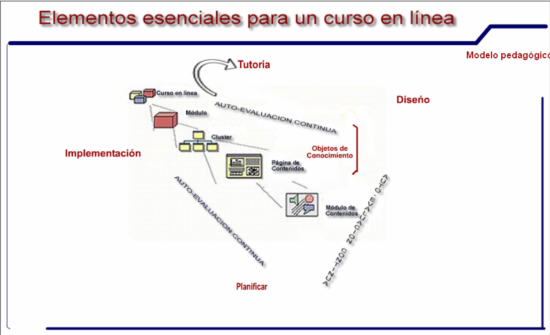
Figura. 3 Elementos esenciales para un curso en línea

Vale la pena resaltar el trabajo colaborativo que generó aportes valiosos para la creación de conocimiento alrededor de temas como el de los elementos esenciales para un curso en línea (figura 3).