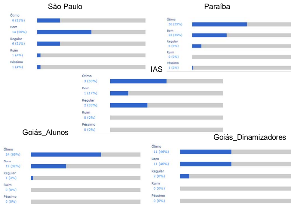
Gráfico 1: Resultado da pesquisa feita em dezembro/2004

Pergunta 1: Como foi sua relação com seus colegas de curso e outros professores que o apoiaram?