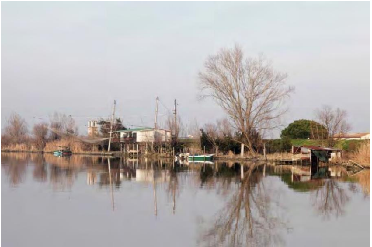
Figura n. 5: Begoña Zubero, GDP/ Serie Le sponde , 2017. Impresión de tintas minerales sobre madera de abedul, lacado mate, 200 x 300 x 5 cm. Colección Iberdrola.

aspectos fragmentarios y contradictorios. Como se vería posteriormente en su trayectoria cinematográfica, se sentía más cómodo en la invención de incertezas, de espacios intermedios en torno a la imaginación, de lugares de desplazamiento de los que la niebla de su Ferrara natal era la mejor metáfora. Se podría incluso decir que el texto reflejaba algunas de las características presentes en la tipología de paisaje fascista utilizados en la propaganda del régimen, sobre todo en cuanto a la aceptación del progreso por parte de la población como algo positivo, la relación entre el paisaje y la historia y la consciencia de lugar en la imaginación nacional. Estas narrativas celebratorias de progreso y destino, situadas en un paisaje mitificado, fueron un principio recurrente en los documentales italianos del periodo (Steimatsky, 2008, pp. 1-39).