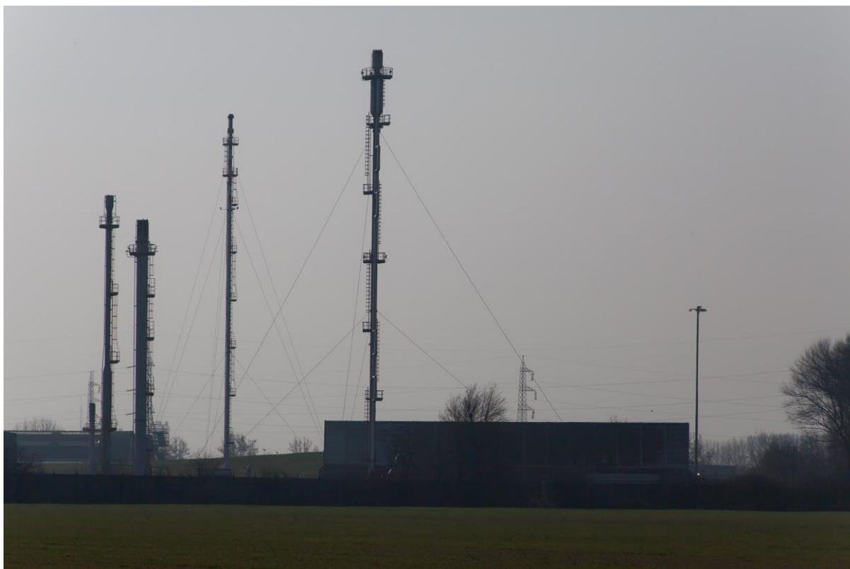
Figura n. 3: Begoña Zubero, GDP/Serie paesaggio industriale , 2017. Caja de luz led.

transformación que estaba experimentando el paisaje y todas las dificultades relacionadas con su representación y su gestión. Un equipo de urbanistas, arquitectos, geógrafos, artistas, historiadores del arte, investigadores e intelectuales pusieron sobre la mesa temas relacionados con las transformaciones del territorio, la pérdida de coherencia, su creciente fragmentación e incesante hibridación, reflexionando sobre la pérdida de los símbolos colectivos y sobre la hiperproducción de otros que ya no lograban responder a las necesidades esenciales de la sociedad (Basilico, 2008, pp. 34-37).