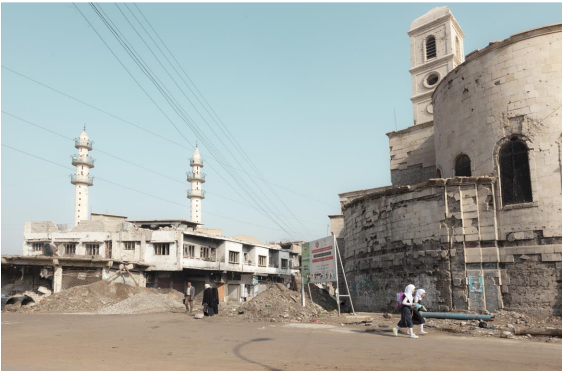
Figura n. 8: Begoña Zubero, Non è esotico, è vitale XVII , 2019, Impresión de tintas minerales sobre papel Hahnemüle 310 gr., 110 x 160 cm.