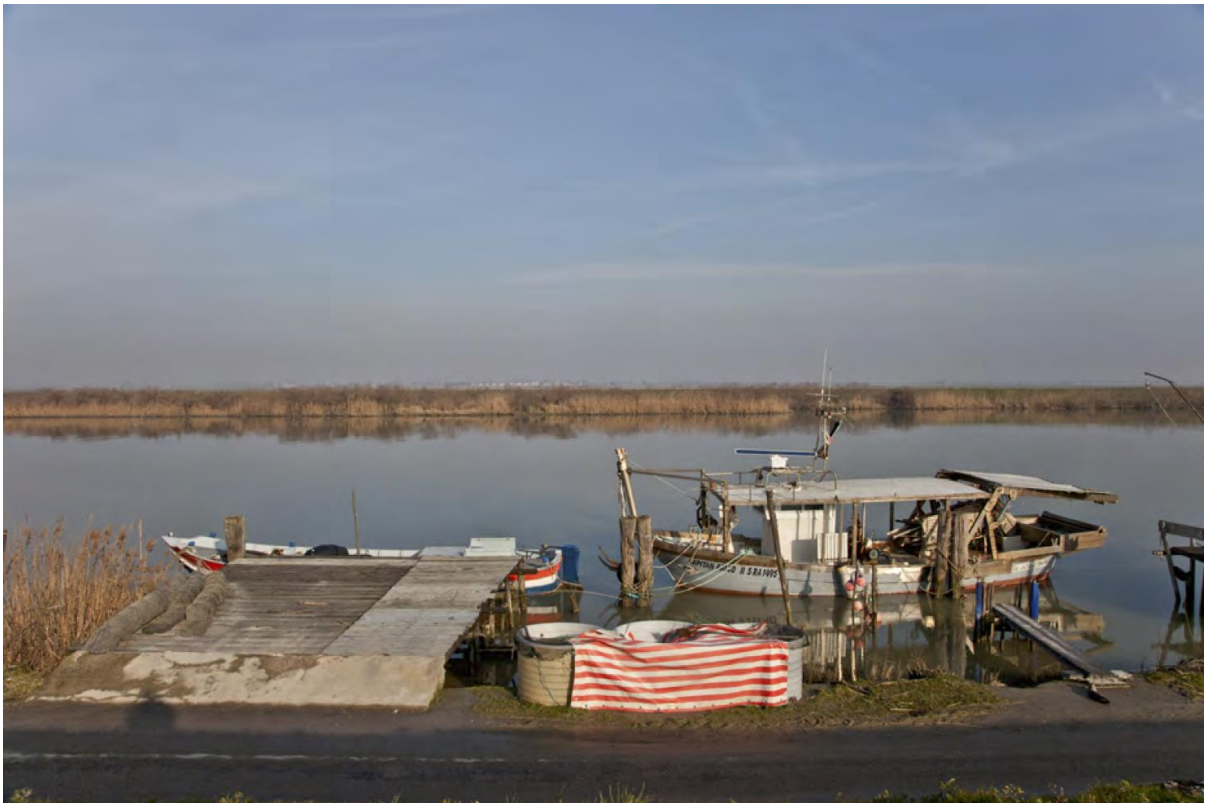
Figura n. 6: Begoña Zubero, GDP/ Serie Le capanne 25 , 2017, Impresión cromalux sobre tablero de densidad media, 40 x 60 x 2 cm.

a la arquitectura como su objeto de estudio, en un giro formal que en esencia mantenía las mismas preocupaciones e intenciones. Para ello utilizó una serie de estrategias que le permitieron crear una obra completamente original sin perder el referente que la inspiró: cambio de la escala, introducción del color, nuevos soportes, encuadres y puntos de vista transgreden el clásico y restrictivo concepto de documental, dando lugar a varias series de fotografías de las que aquí mencionaremos dos. Le sponde (Figura n. 5) destaca por su voluntad estético-pictórica, que no pictorialista, que asume parte de la concepción clásica del paisaje como exponente del arte de la contemplación, con el uso de la gran escala, las cuidadas composiciones panorámicas y las perspectivas, recursos más propios del lenguaje y tradición de la pintura. Incluye imágenes que nos pueden sugerir un espacio natural no intervenido que en realidad no es más que una ilusión que se rompe al observar la gran cantidad de huellas antrópicas que aparecen en otras fotos. El paisaje se convierte en depositario de la identidad, memoria e imaginación de la colectividad, haciendo presente la épica de la vida cotidiana a pesar de la ausencia de la figura humana.