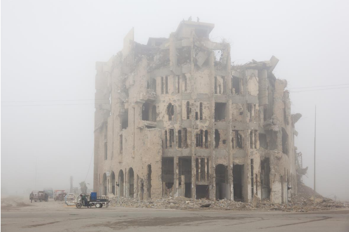
Figura n. 7: Begoña Zubero, Non è esotico, è vitale VII , 2019, Impresión de tintas minerales sobre papel Hahnemüle 310 gr., 110 x 160 cm.