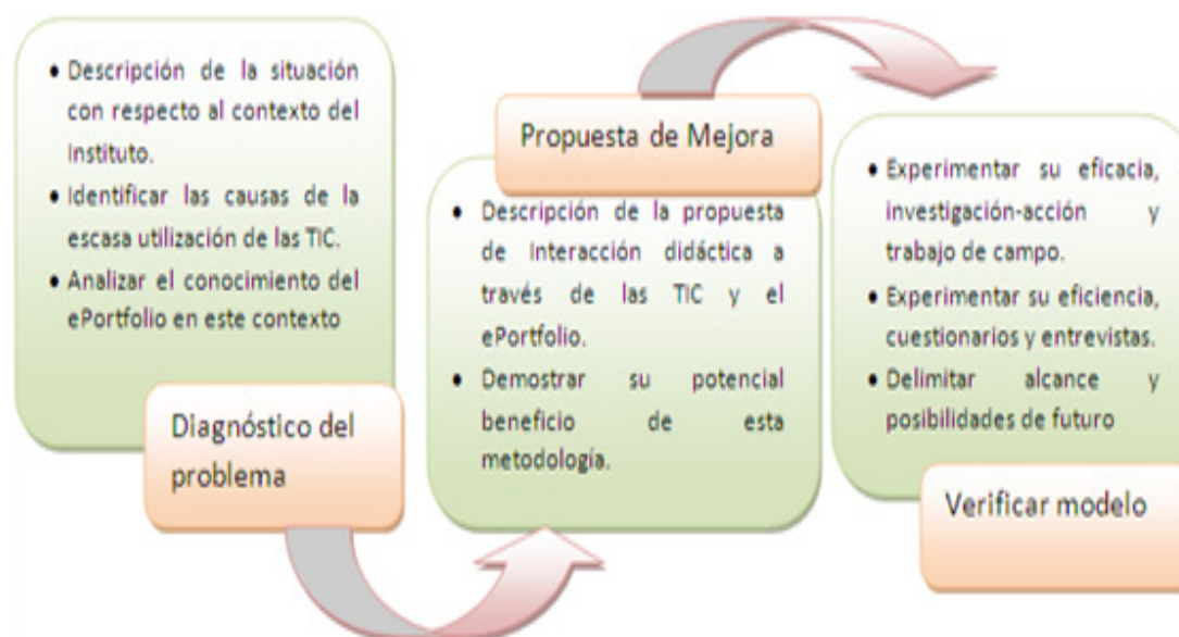
Figura 4. Diseño del proceso de investigación