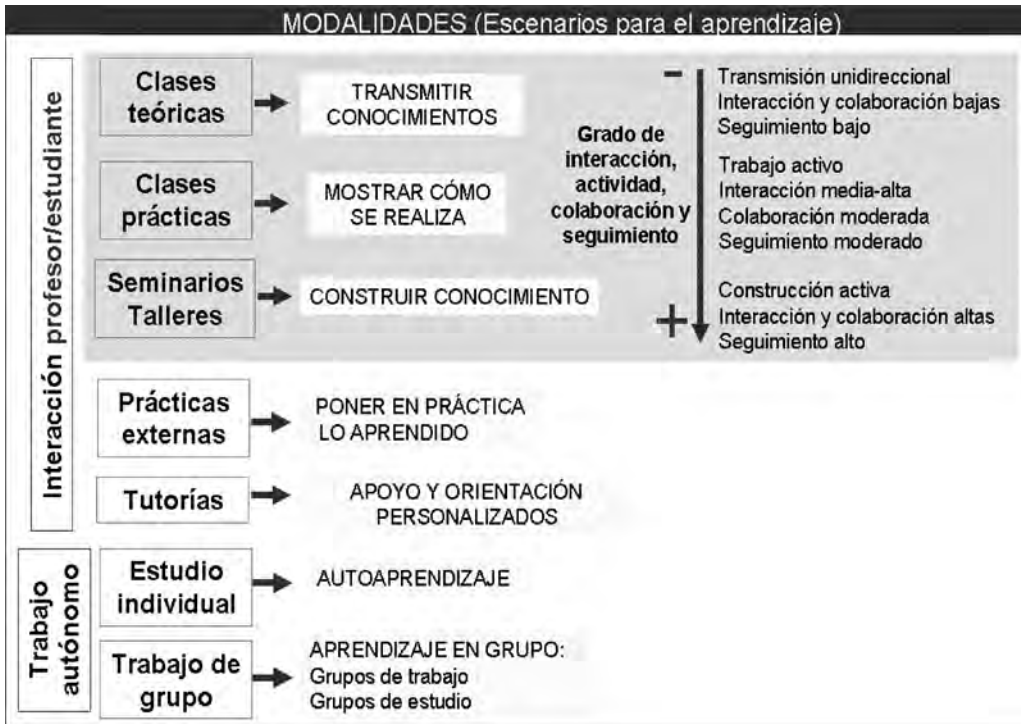
Cuadro 1: Los escenarios o modalidades definidos por Mario de Miguel, adaptados a la UNED mediante la categorización de espacios de interacción profesor/estudiante y espacios de trabajo autónomo del estudiante.

Por otro lado, otra diferencia en relación con la implementación de estas modalidades y escenarios en la UNED tiene que ver con la necesidad del recurso a medios tecnológicos para facilitar los tipos de interacción que requiere cada una de estas modalidades.