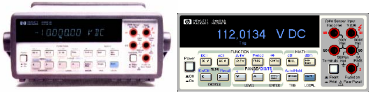
Figura 1: Multímetro digital real y su homólogo virtual

En los tres casos se pretende que el estudiante se encuentre ante una interface que reproduzca con la máxima fiabilidad los sistemas y procesos con los que va a trabajar. Por este motivo se están dedicando muchos esfuerzos a diseñar la imagen virtual de instrumentos de laboratorio para conseguir que su modus operandi sea idéntico al del instrumento real (Fig. 1).