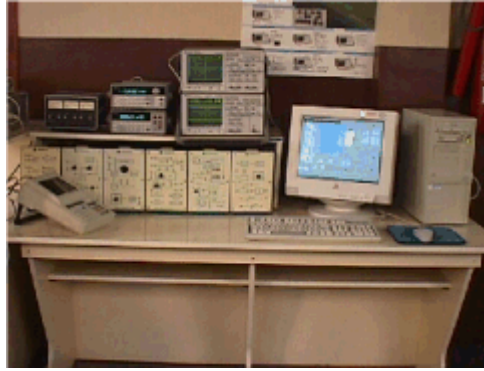
Figura 2: Estación de trabajo de un Laboratorio Remoto Interactivo de teoría de circuitos