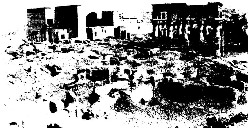
Figura 6. Templo de Isis