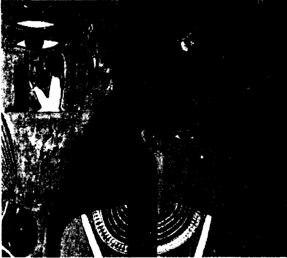
Figura 1. Isis con el trono. Tumba de Nefertari. XIX dinastía.

Si existe una divinidad femenina que llegó a gozar de la más alta consideración y popularidad dentro de la historia egipcia desde los momentos más tempranos hasta el período grecorromano, e incluso influyó en la religión cristiana, ésta no fue otra que Isis.