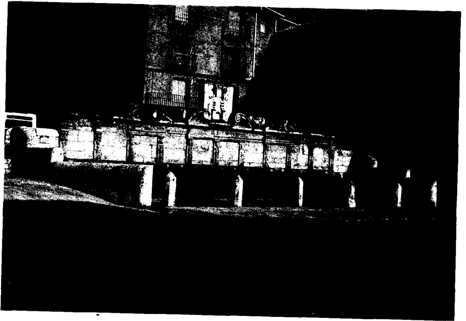
Fotografía (lam. II) Fuente de los Veinte Caños.