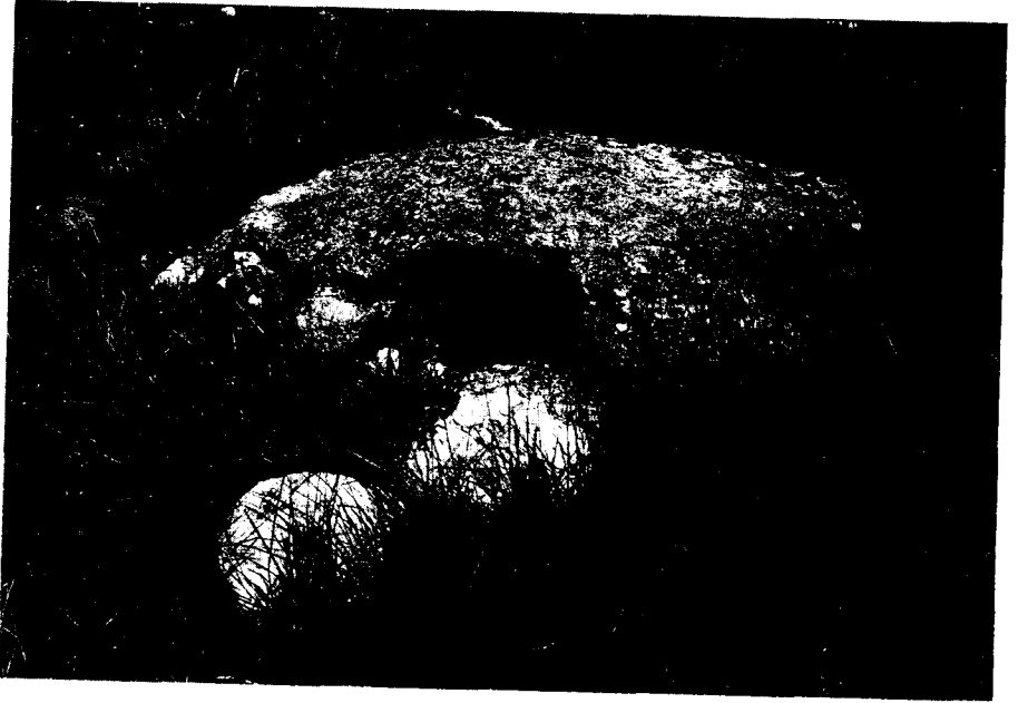
Fotografía (lam. I) Arca.