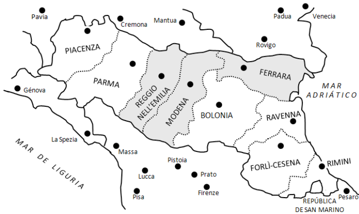
MAPA 3. FERRARA, MÓDENA Y REGGIO EN EL MAPA POLÍTICO ITALIANO ACTUAL