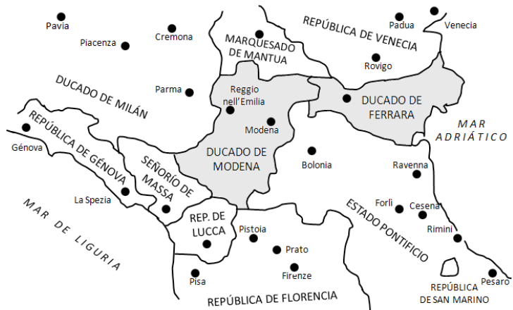
MAPA 2. LOS DUCADOS DE FERRARA Y MÓDENA-REGGIO, DOMINIOS DE ESTE A FINALES DE LA EDAD MEDIA