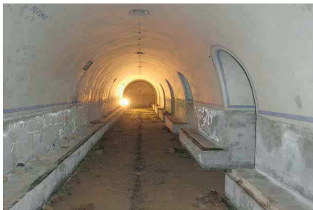
FIGURA 3: INTERIOR ABOVEDADO REFUGIO COLEGIO BALMES.

Tiene una superficie de 3.935 m 2 . Consta de dos partes. La principal es el cuerpo de las dos naves en las que existen siete pilares a distancia de seis pasos, con bancos corridos con mampelanes de madera y una cenefa azul que dibuja el encuentro de las bóvedas. La otra parte son las rampas de acceso (una fue modificada por el colegio en reformas de 2003), cuya cubierta es una losa armada de aproximadamente 1,50 m de es-