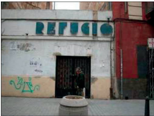
FIGURA 2: ENTRADA REFUGIO CALLE SERRANOS, 25.

Este espacio tiene una superficie de 392 m 2 , perteneciente al tipo de refugio adintelado de planta alargada. Está sustentado por columnas robustas rectangulares. Conserva bancos corridos en las paredes y alrededor de los pilares. Presenta dos