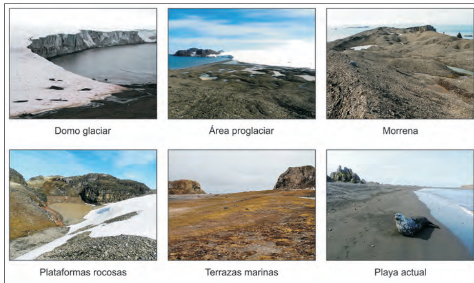
FIGURA 2. FOTOGRAFÍAS DE LOS SEIS AMBIENTES GEOECOLÓGICOS DIFERENTES EN PUNTA ELEFANTE. Elaboración propia.

La cartografía de la distribución espacial de los ambientes geocológicos en Punta Elefante se basó en la identificación de unidades geomorfológicas y la distribución de la fauna y flora existentes en esos ambientes. En este sentido, fueron identificados seis ambientes diferentes (Tabla 1 y Figura 2):