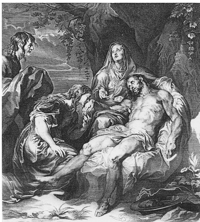
Fig. 12. Paulus Pontius según composición de Anton van Dyck. Llanto sobre Cristo muerto.

resuelto con la presencia de Cristo en el regazo de la Virgen, mientras que la Lamentación se muestra más narrativa y con un mayor número de personajes. En realidad la iconografía de la Piedad deriva del threnos bizantino que no es más que la lamentación de la Virgen sobre el cuerpo muerto de Cristo. El tema hunde sus raíces por tanto en el arte bizantino, donde aparece por primera vez, y se impregna de la literatura mística medieval. En este lienzo se ha elegido el momento en el que la Virgen ubica el cuerpo de su hijo entre sus rodillas, rodeado de personas que se lamentan por su muerte. Sigue por tanto la línea más tradicional y pasional del tema, pero añade un detalle interesante, el instante en el que el cuerpo de Cristo fue lavado para posteriormente ungirlo con mirra y áloe y amortajarlo con el sudario, según narra el Evangelio de San Juan. Esta costumbre se practicaba en los ritos funerarios judíos, que mezclaban mirra y áloe en los ungüentos para preservar y perfumar los cuerpos antes de su amortajamiento. Este momento purificador se advierte con claridad en la disposición de San Juan con el paño en la mano y en la presencia de la jofaina, en primer plano, con restos de sangre.