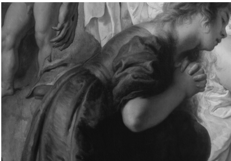
Fig. 6. Lamentación sobre Cristo muerto. Detalle de la Magdalena.