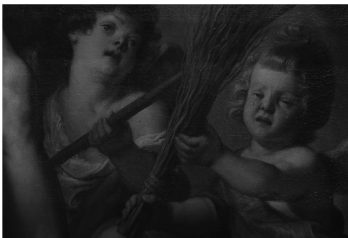
Fig. 8. Lamentación sobre Cristo muerto. Detalle de los Ángeles.

de Cristo se sitúan dos rollizos angelotes en movida actitud. El primero tiene la pierna izquierda arrodillada y la derecha flexionada, y muestra con sus manos un haz de varas anudadas con las que Cristo fue azotado (Fig. 8). Está tan sólo cubierto por un manto de color verde turquesa que deja al desnudo casi todo su costado izquierdo. Es de cara alargada y rellenita, con buenos mofletes; de tez blanca y sonrosada, claramente norteña, y pelo rubio, algo rizado y desgredado. Tiene el rostro apenado y desconsolado, con los ojos pequeños y semicerrados por el llanto que no cesa y que corre por sus mejillas. Es idéntico al que aparece en la obra titulada Cristo crucificado con San Francisco y la Magdalena del Museo de Bellas Artes de Saint Quentin 51 . Su compañero ocupa un plano más discreto, sentado y recostado sobre el montículo en el que Cristo y la Virgen están situados. Viste camisola blanca y manto marrón con el hombro izquierdo y la pierna al descubierto. Lleva en sus manos la vara con la esponja empapada en hiel que fue ofrecida a Cristo sediento. Es también de cara rolliza, con una magnífica melena de tono castaño y algo encrespada. Tiene los ojos grandes y turbados por el dolor y el llanto, ahora interrumpido. Es de nariz chata, boca pequeña y entreabierta, con labios carnosos y un simpático hoyuelo en el mentón que sobresale de su incipiente papada.