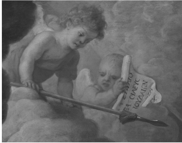
Fig. 10. Lamentación sobre Cristo muerto. Ángeles celestiales.