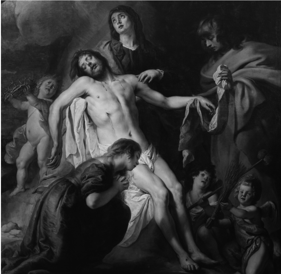
Fig. 11. Lamentación sobre Cristo muerto. Detalle.

La paleta empleada en el lienzo es amplia, como suele ser habitual entre los grandes pintores, pues los maestros más mediocres tienden a trabajar con un limitado abanico cromático. Los análisis químicos nos han permitido conocer los pigmentos y colores empleados, además de su cadencia de uso. De todo ello se extrae, que los más empleados fueron el carbonato cálcico, albayalde y negro hueso 59 . La paleta cromática está bien compensada y equilibrada, combinando los tonos calidos con los fríos, algo muy habitual en la producción de Crayer. La presencia de un intenso bermellón la encontramos en muchas de las obras de este pintor; se emplea en las ropas de personajes a destacar y en cortinajes que proporcionan un efecto teatral y escenográfico presente en la pintura de este siglo. Los azules también son constantes en la obra de este artista, normalmente destinados a la indumentaria de la Virgen, pues es el color que le corresponde, pero también