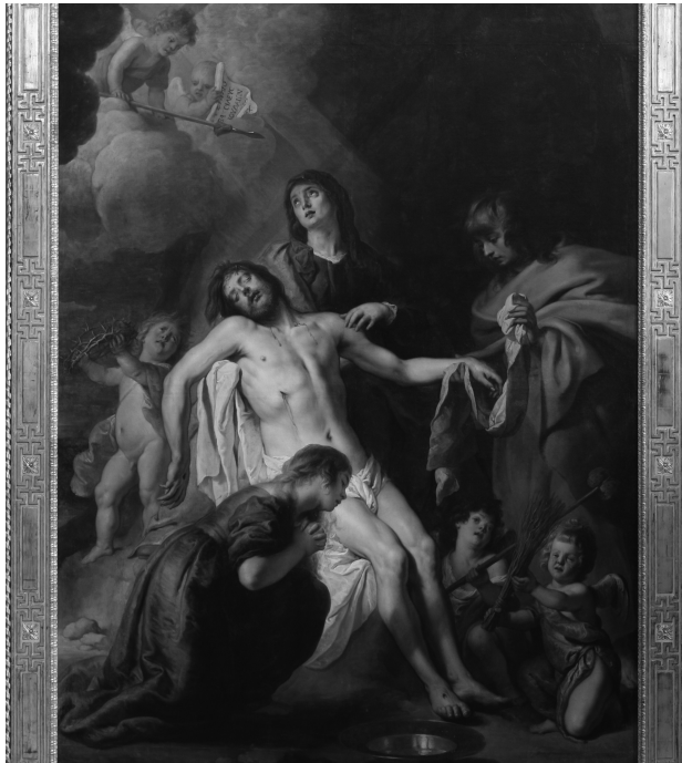
Fig. 1. Gaspar de Crayer (atrib.) Lamentación sobre Cristo muerto . Vitoria-Gasteiz. Museo Diocesano de Arte Sacro. Elizbarrutiko Arte Sakratuaren Museoa.