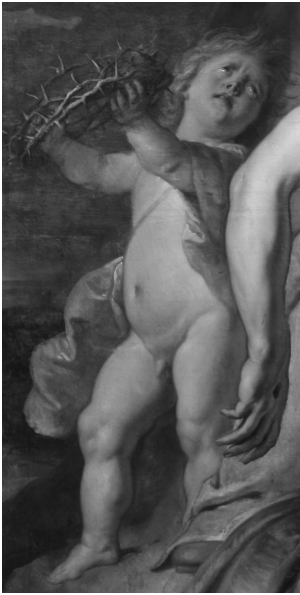
Fig. 9. Lamentación sobre Cristo muerto. Detalle Ángel con corona.

muestra la corona de espinas dirigiendo su mirada al lugar del que procede este macabro atributo. Al igual que sus compañeros es de cara redonda y regordeta, con buenos mofletes e incipiente papada. Dispone de una agitada melena rubia y una expresión desencajada potenciada por unos ojos afligidos y una boca entrea-bierta que muestra un dolor difícilmente contenido. El cortejo de ángeles se completa con los situados en el ángulo superior izquierdo (Fig. 10). Se asoman entre nubes y parecen meros espectadores del dramático momento que se está viviendo en la escena. Portan la lanza y un pergamino con parte de la inscripción que se puso sobre la cruz en griego, latín y hebreo. Es evidente que no forman parte del conjunto y que fueron realizados por otra mano. No son tan frescos y llenos de vida como el resto y pecan de cierto estatismo y falta de naturalidad. Los rostros no logran la expresión de dolor contenido del resto de los personajes y más parecen enfadados o enfurruñados.