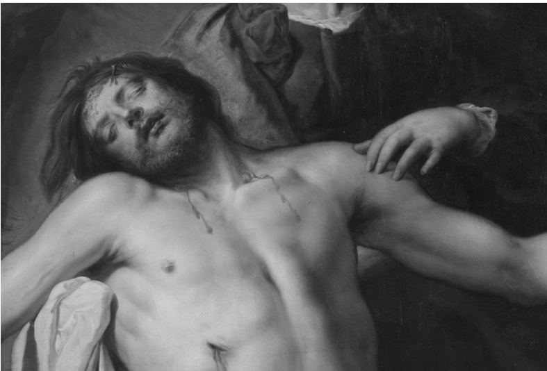
Fig. 4. Lamentación sobre Cristo muerto. Detalle de Cristo.

ladeada hacia la derecha, apoyada sobre su hombro y sobre el brazo de la Virgen. Los ojos cerrados, pero hinchados y desencajados por el sufrimiento recibido; la nariz recta y prominente, y los labios inflados y amoratados como es habitual en los cadáveres. La frente herida y sangrante con una espina clavada como muestra de martirio, detalle habitual entre algunos pintores flamencos. Tiene alborotada melena y barba poblada de tono pajizo, lo que contrasta con su cuerpo absolutamente lampiño. Un halo de luz celestial ilumina su rostro en referencia a su carácter divino.