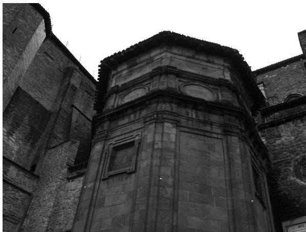
Fig. 2. Capilla de Santo Cristo. Vitoria-Gasteiz. Catedral de Santa María.