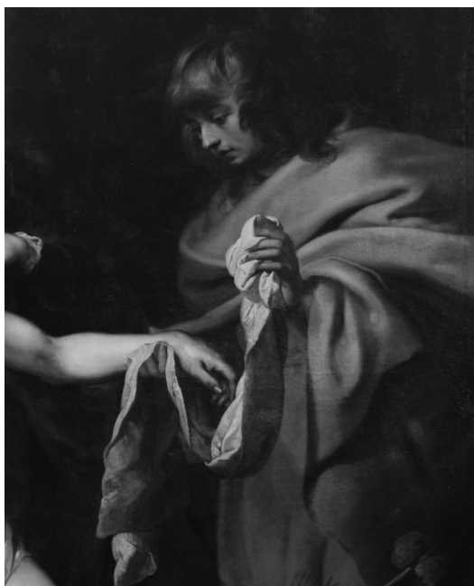
Fig. 7. Lamentación sobre Cristo muerto. San Juan.

Los cuatro protagonistas principales se acompañan de un reducido cortejo de ángeles que participan activamente en la escena. Todos ellos portan los Arma Christi , o instrumentos del martirio de Cristo. En primer plano a los pies de San Juan y