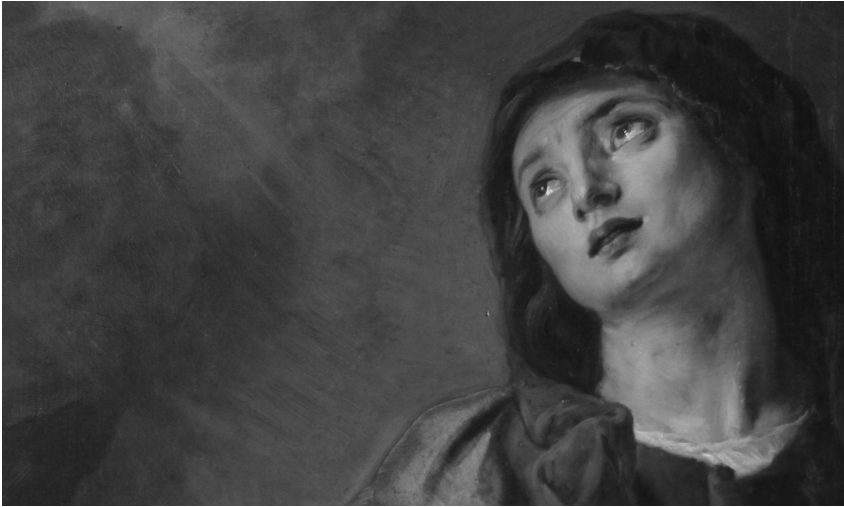
Fig. 5. Lamentación sobre Cristo muerto. Detalle de la Virgen.