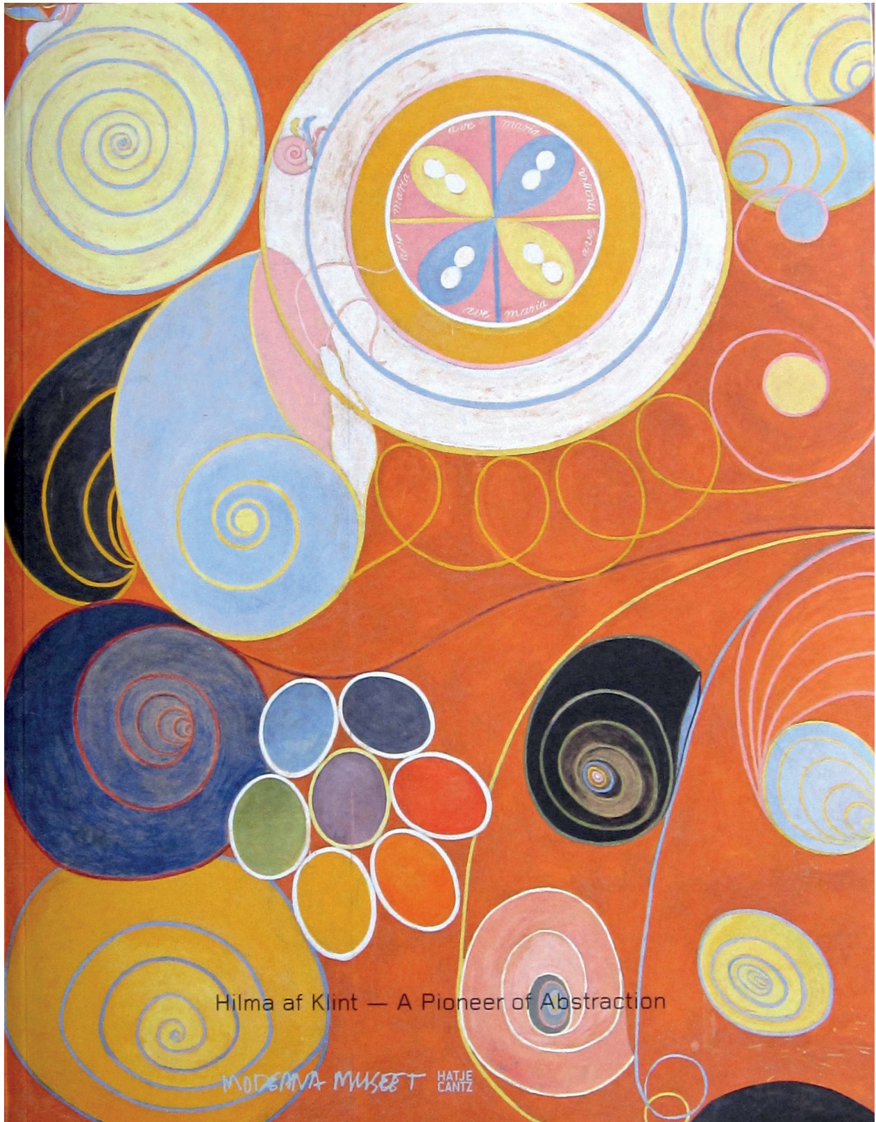
FIGURE 3. COVER OF THE CATALOGUE HILMA AF KLINT: A PIONEER OF ABSTRACTION Moderna Museet, Stockholm, 2013.