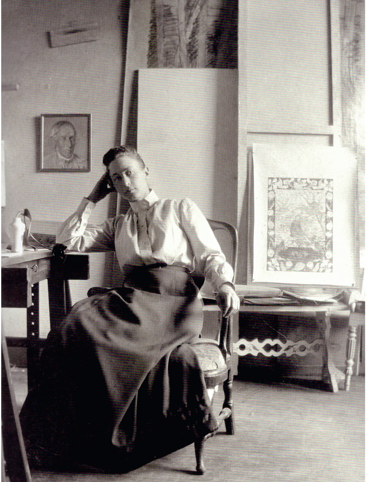
FIGURA 4 HILMA AF KLINT IN HER STUDIO, C. 1895