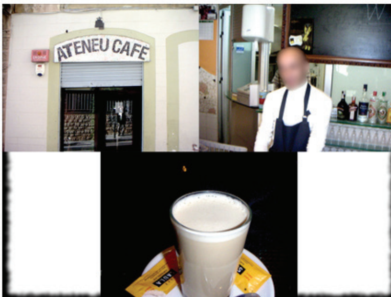
Figura 5. Collage del café. Fotografías 19, 20 y 21 de Rafael.

Hombre, el descanso, el descanso. [...] Claro, te estás relajando, sí, sí. Hablamos, con los otros, ver tele, las revistas, no sé [...]. Lo otro, claro, es más mecánico, estás escribiendo, corrigiendo, lo que es más mecánico, más rígido, en el descanso te relajas. Eso creo que le pasará a casi todo el mundo, aunque no lo digan, que dices “es lógico” ¿no? (David, entrevista personal, 28 de diciembre de 2011, ver Figura 5).