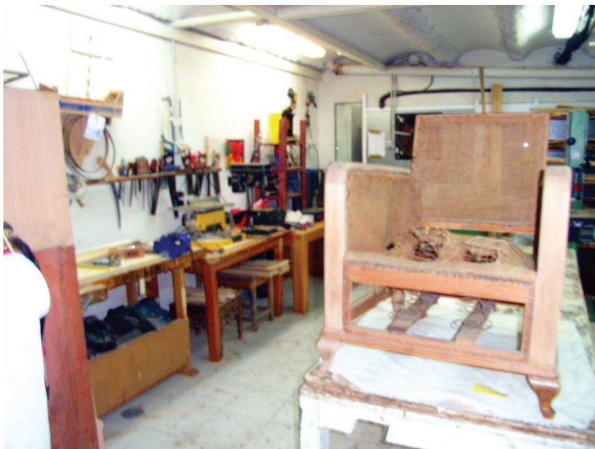
Figura 3. Fotografía 2 de Óscar

Óscar: En el sillón éste, pues lijar, saber que lo has lijado y que, que, luego tienes que teñirlo o barnizarlo tú solo, pues sí que siento independencia, sobre todo con, de las tareas que hacemos con los muebles, con la que más [...] más gratificantes, y cuando, cuando acabas, también cuando pones el barniz bien puesto, o lo enceras un mueble ya, cuando está barnizado, le pones cera y lo acabas de pulir, limpiar, pues también, también (Óscar, entrevista personal, 11 de abril de 2012, ver figura 3).