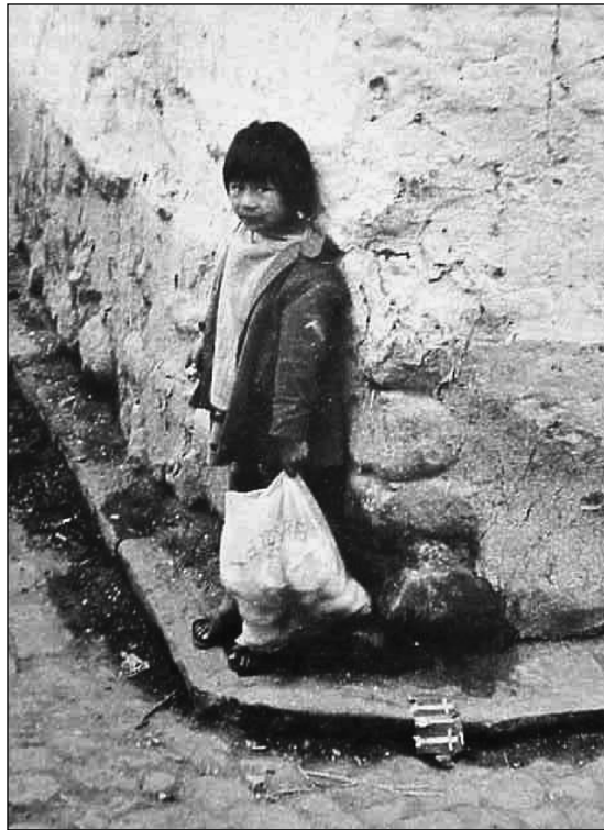
Alto el Perú

La imagen fotográfica recoge también la detención de un instante al que se refiere en otra de sus últimas obras, La raíz del ombú (1980) 23 , reeditada recientemente. El propio Cortázar indica en el prólogo la repercusión de dos elementos en la actualidad: la imagen y lo instantáneo: «Surgió en París y Roma la idea, hacer una novela utilizando la combinación de imagen y palabra, que podría ser un método eficaz para romper la barrera entre el narrador y el gran público, sobre todo en el tiempo de las lecturas veloces, avasallamiento de imágenes y trepidación del cine y la televisión. A esto se añade la popularidad alcanzada por las historietas y relatos de cursilería romántica ya editados en cuerpo de novela». En esta obra se combinan de nuevo, al igual que en las últimas obras de Cortázar, la imagen y la palabra. Y al igual que