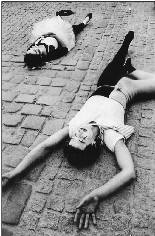
París, ritmos de una ciudad

De igual modo, la afirmación de la imagen en cuanto tangible, visual, se ve abocada, como ocurre en Las babas del diablo , a su negación o a su proyección más allá de la propia imagen. Es decir, escapar a los propios límites de la realidad. En el fondo de la cuestión surge la lucha contra esta realidad tangible, una búsqueda de otra realidad —una vez perdida, tras la muerte de Dios, su proyección al infinito—; y se hace presente. Las alas de la rebeldía, el enfrentamiento existencial con lo infinito, que da validez de aserto a la ciencia, en cuanto aseveración de verdades indiscutibles. De ahí la rebelión: « tensas aletas rasgan furiosamente el filo del agua: Nietzsche, Nietzsche » 10