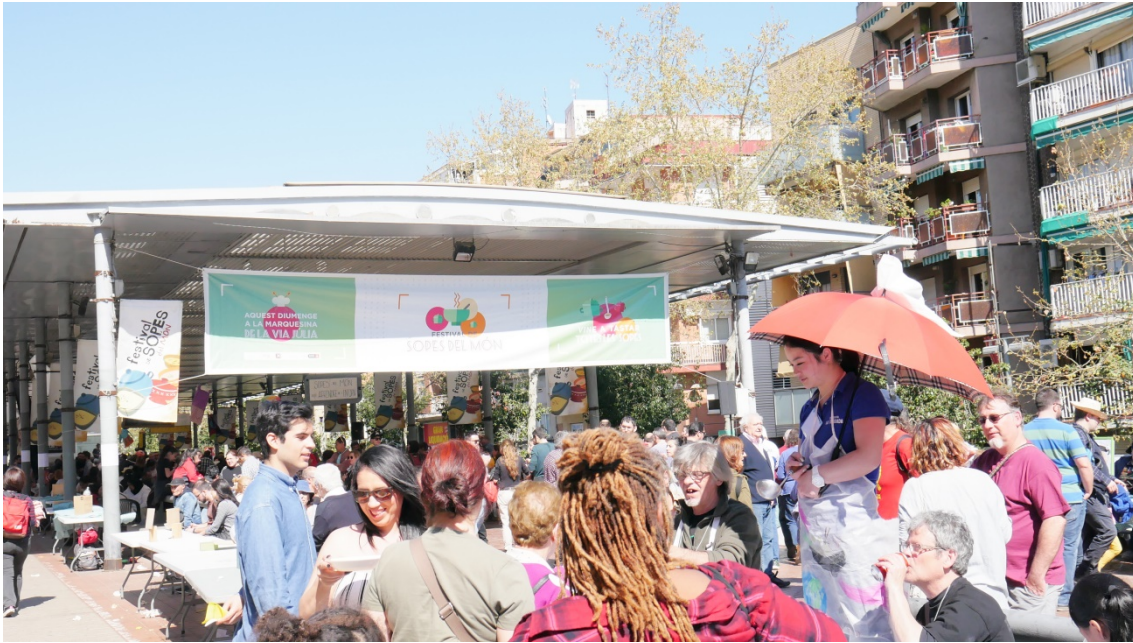
Mesas donde se servían sopas fuera del techo de la Marquesina