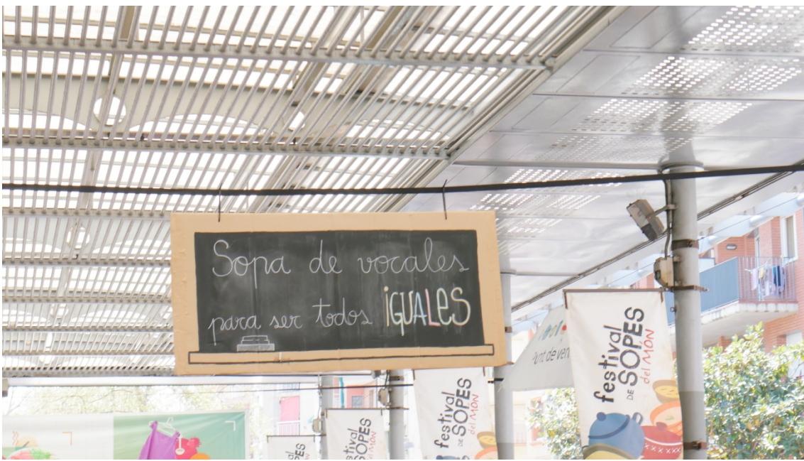
Diferentes carteles contenían mensajes “educativos en interculturalidad”