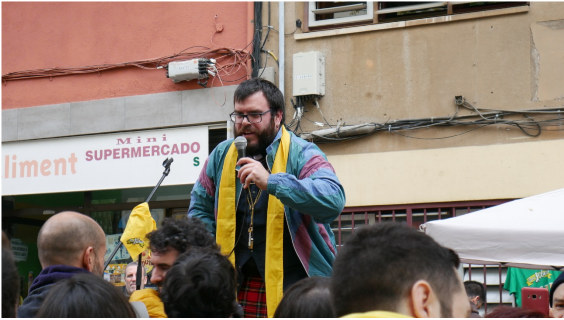
“Cura” bautizando a los nuevos adeptos en la religión del San Xibeco