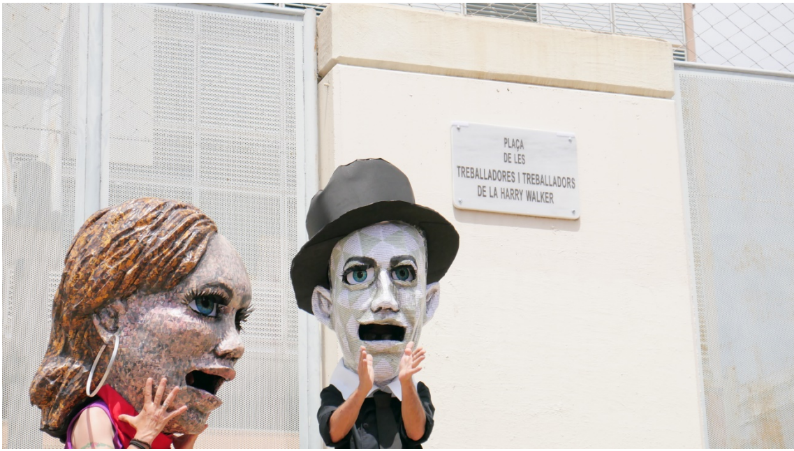
“La Prospe” y “el Pestaña”