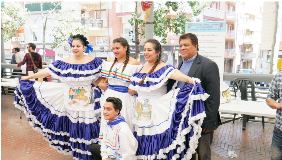
Representación hondureña en el festival