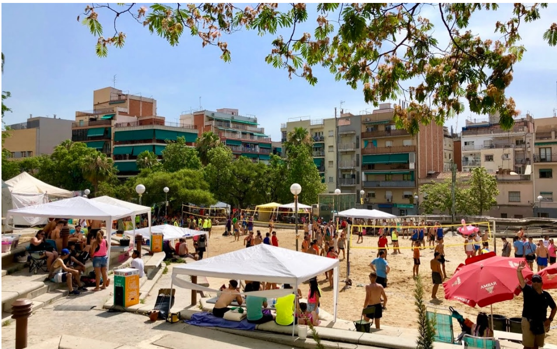
Plaza Ángel Pestaña el día del torneo 4x4 vista desde las gradas