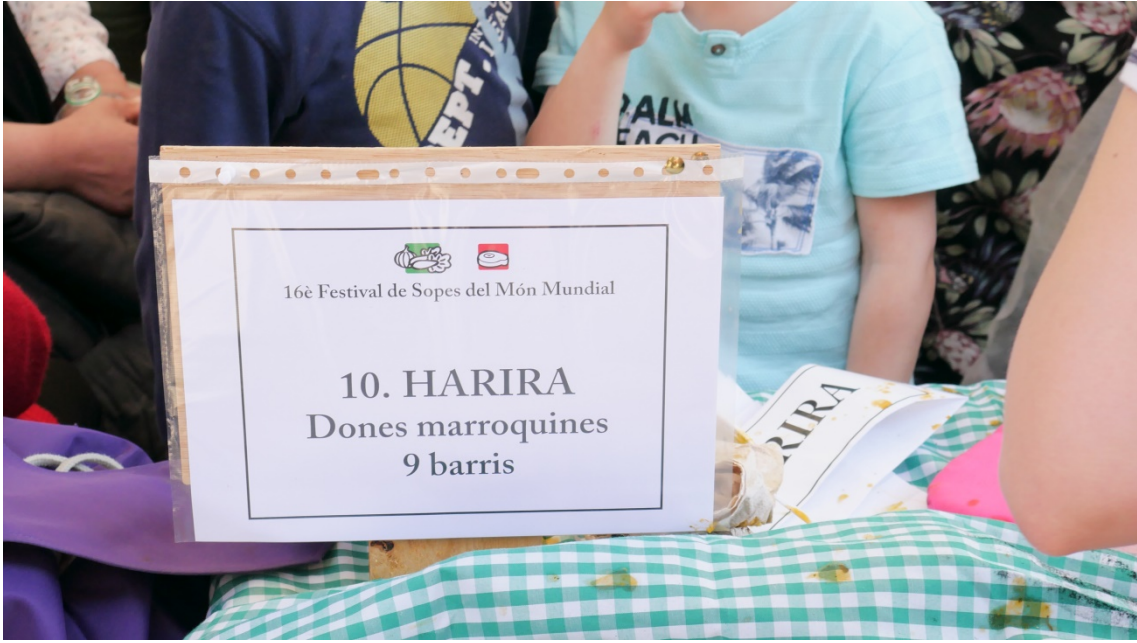
Una de las sopas más demandadas fue la servida por las “Mujeres marroquí 9 barris”