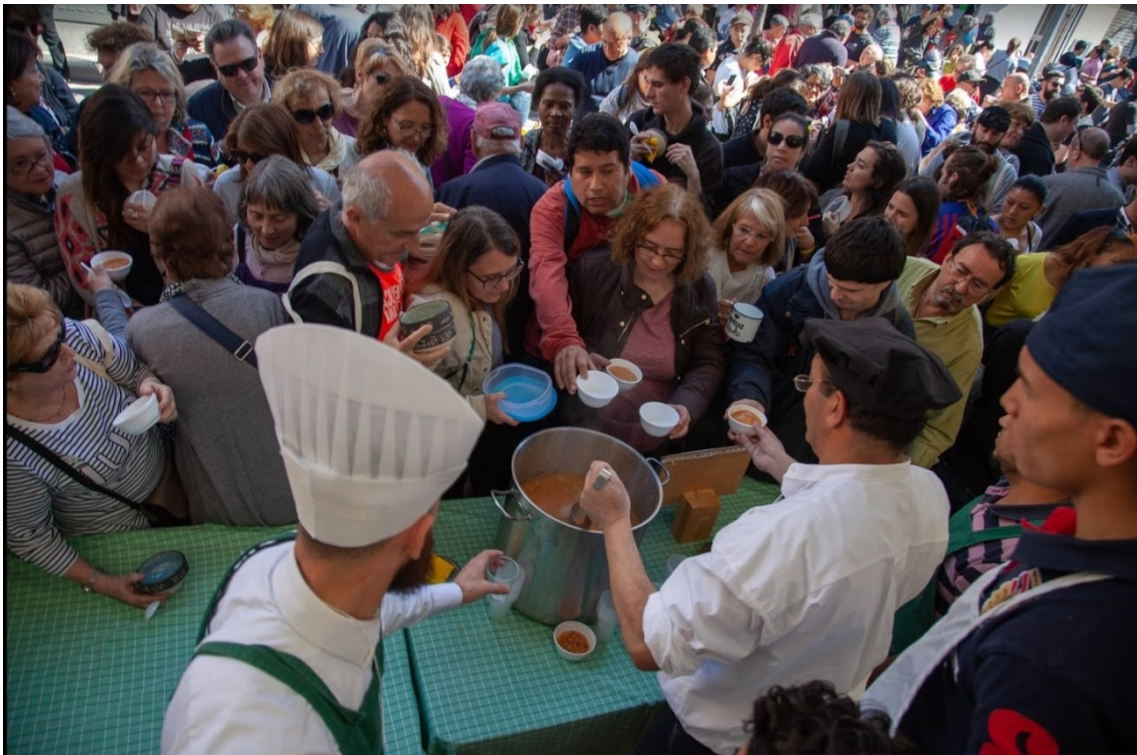
Sirviendo sopas a ritmo frenético nada más empezar