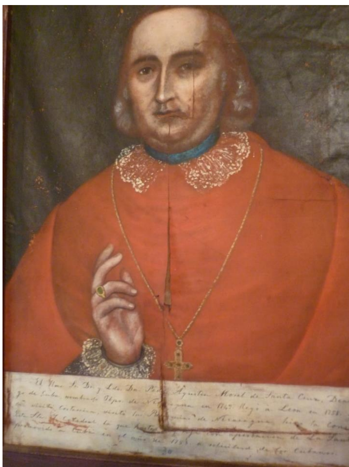
Ilustración 3. Agustín Morell de Santa Cruz, 1753.

La presión fiscal y las amenazas físicas que los ocupantes ingleses realizaron a la población de La Habana también fue aplicada a los miembros del Estamento Eclesiástico, una decisión que les provocó estupor e indignación. En el reparto de exacciones y donativos que realizó Albermale entre los vecinos de la ciudad también se incluyó a la Iglesia Católica y al propio obispo Morell. La solicitud de pago de 2.000 pesos realizada al propio obispo le provocó una gran consternación puesto que vio como no se respetaba la exención tributaria de la que