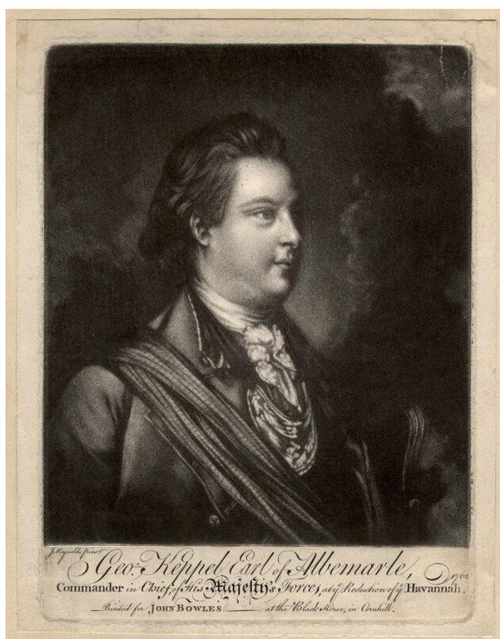
Ilustración 1. George Keppel, conde de Albermale.

Por esa razón, una vez firmada la Capitulación por ambas partes se puso en manos de los vencedores la ciudad de La Habana y su entorno, los caudales, la escuadra fondeada en el puerto, las armas y cañones, así como todos los bienes que pudieran satisfacer las necesidades inglesas o que se pudieran vender. Una vez ocupada la plaza habanera el almirante