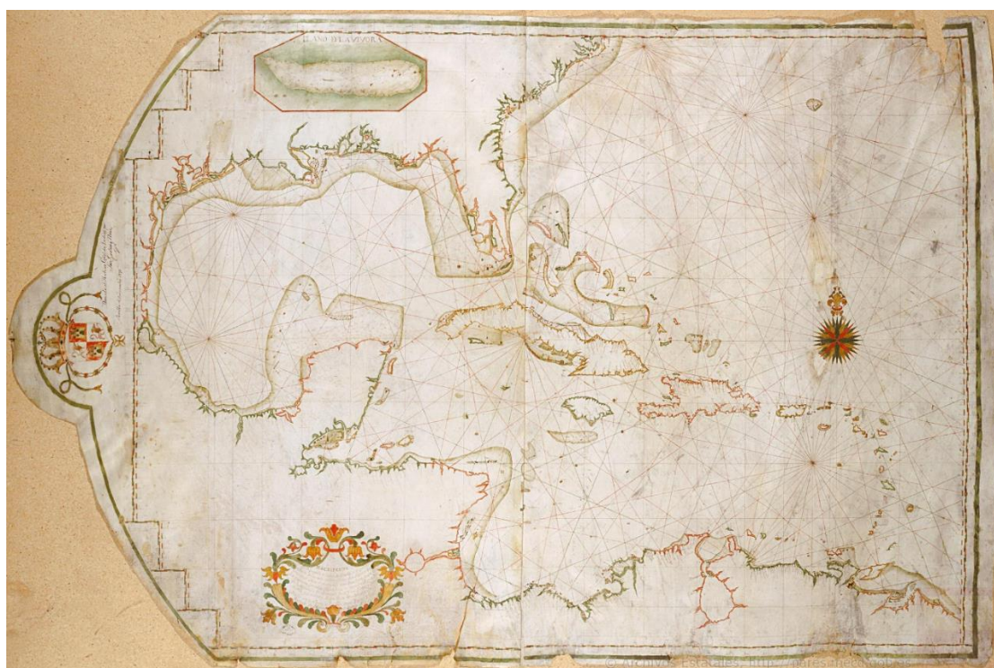
Mapa 1. Carta náutica de las Antillas Mayores, año 1734. (Fuente: AGI, 1734).

Se reproduce una Carta Náutica 1 del año 1734, atribuida a Antonio de Abreu y Matos, donde puede apreciarse lo anteriormente expuesto.