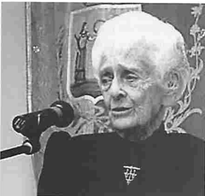
Rita Levi Montalcini en el curso de una conferencia.