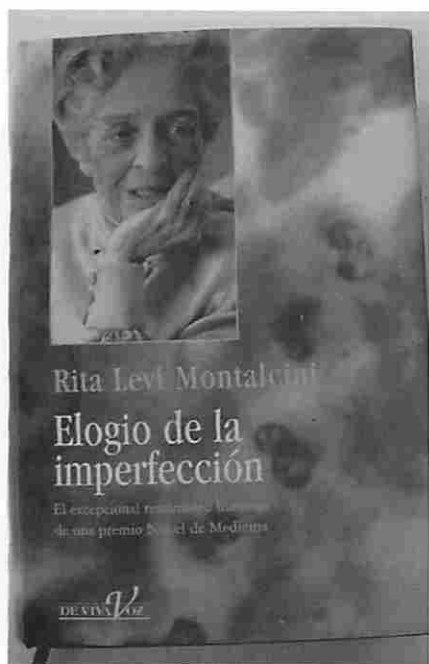
Portada de su libro autobiográfico.

chicas, pues se daba por descontado que la carrera que nos esperaba era la de ama de casa, buena esposa y madre. Aunque las tres habíamos demostrado una capacidad excelente para los estudios, nuestro padre decidió que seguiríamos la enseñanza media y luego la escuela secundaria femenina, que aquella época no posibilitaba el acceso a la universidad las diferencias con su homólogo masculino residía en las matemáticas y las llamadas ciencias exactas”.