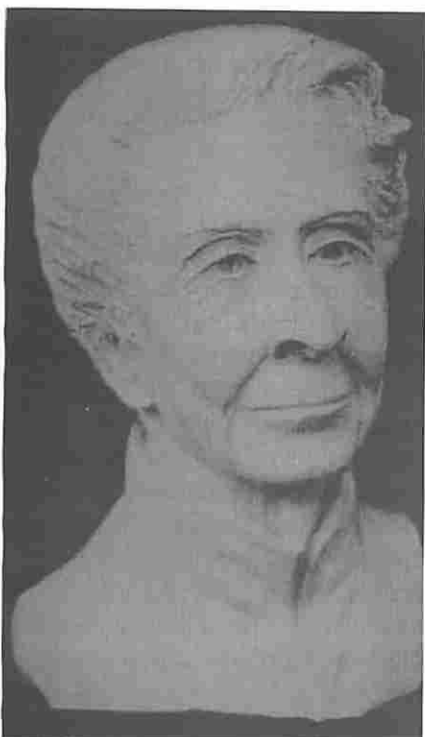
Busto de Rita Levi Montalcini.