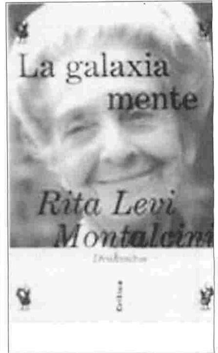
Uno de sus últimos libros.

entre dos continentes", tal como ella la definía, finalizó en 1976, año en el que regresó definitivamente a Italia.