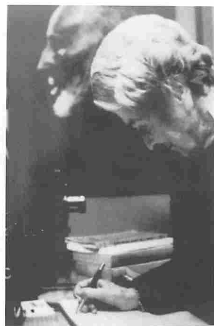
Firmando en el Libro de Honor del Instituto Cajal de CSIC, en 1988.

Durante su etapa americana Rita Levi Montalcini mantuvo unos fuertes vínculos de unión con su país y su familia, con la que pasaba un mes cada año. En 1960, tras una conferencia sobre el NGF que había suscitado un considerable