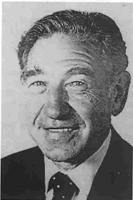
Stanley Cohen, con quien compartió el Premio Nobel.