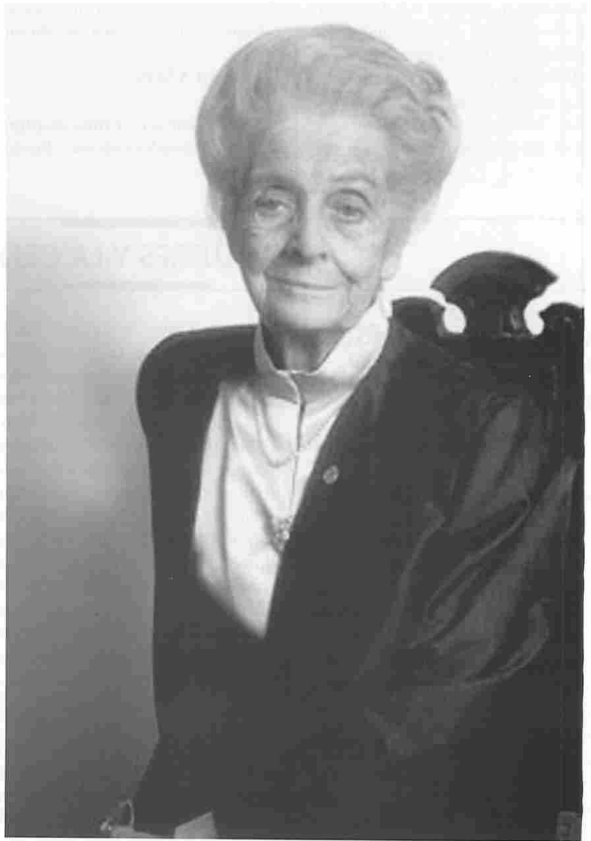
Rita Levi Montalcini en una de sus últimas fotografías.

...fía, Elogio de la Imperfección, publicada en España en 1989. "En cambio, en lo referente a la religión, me encontré en un apuro cuando me plantearon por primera vez la pregunta, dado que no tenía sino ideas vagas acerca de la cuestión. ¿Eres judía, israelita o qué diablos eres? Le consulte a mi madre, y ella me dijo que era mejor preguntárselo a papá. Él me acarició amablemente el cabello y me contestó con una seriedad que me impresionó: