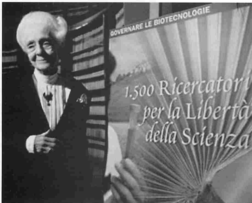
Rita Levi Montalcini activa reivindicadora del papel social de la ciencia.

El reconocimiento de la figura de Rita Levi Montalcini por parte de la comunidad científica es notorio. Así lo demuestran los numerosos premios, doctorados honoris causae y condecoraciones que posee, entre ellas el Premio Rosenstiel de la Universidad Braudein (1982) el Premio