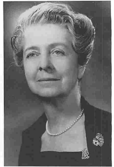
Rita Levi Montalcini en su etapa americana.

Sus comienzos en la Washington University de Saint Louis (Missouri) estuvieron llenos de dudas tanto sobre sus investigaciones como sobre la propia neuroembriología como campo de investigación. Dudas que terminaron a finales del otoño de 1947, al estudiar una serie de secciones de