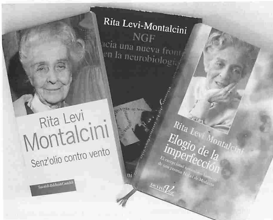
Rita Levi Montalcini es autora de numerosos libros.