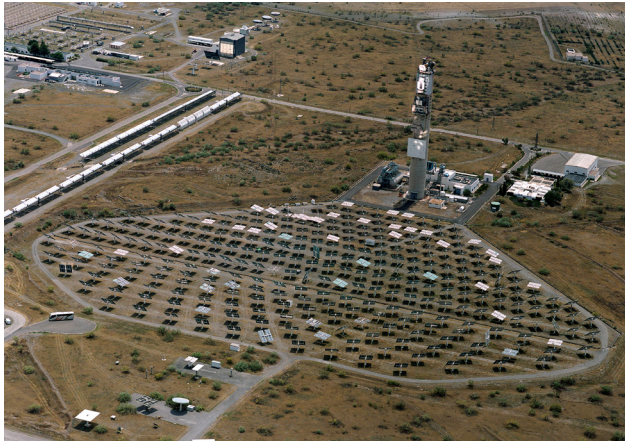
Figura 5. Plataforma solar de Almería.

energía eólica, principalmente de baja potencia para dar soporte tecnológico y de certificación y homologación a la empresas españolas, en la energía fotovoltaica, en la que se hace investigación de base en nuevos materiales al tiempo que presta servicios técnicos de caracterización y duración a la empresas de nuestro país, en la energía solar de concentración a través de la plataforma Solar de Almería, la más completa del mundo para el desarrollo tecnológico de esta energía, en la que se coordina el Programa Conjunto de EERA y, en general, todas las iniciativas relevantes de la UE. También se realiza I+D sobre energía de las olas, labor esta que se lleva a cabo en el Departamento de Tecnología. Además de todas las tecnologías renovables de generación, se realiza investigación aplicada sobre tecnologías facilitadoras, como son el almacenamiento energético y las redes inteligentes. Otro campo que centra la atención del CIEMAT es el de la eficiencia energética en la edificación y las ciudades inteligentes, de indudable interés por la importancia que tienen estas tecnologías en la política energética de los países, y en particular en España. La investigación y desarrollo anterior se complementa muy bien con los estudios de ciclo de vida de las tecnologías que permiten cuantificar la huella medioambiental integrada, facilitando la decisión sobre políticas de internalización de costes de las mismas.