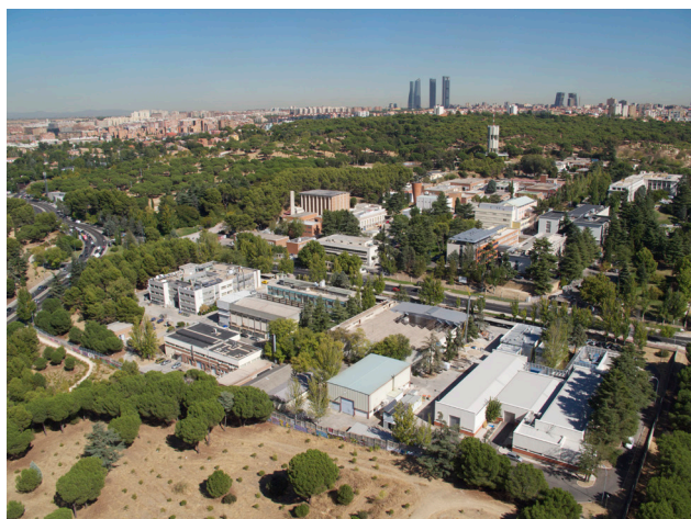
Figura 4. Vista aérea del CIEMAT.

Con gran celeridad, el CIEMAT ha ido experimentando desde 1986, además, un cambio profundo en sus formas de gestión y en su aproximación a la sociedad y a la industria, en gran parte conformado por la nueva Ley de la Ciencia de 1986 y su Plan Nacional de Investigación, y por la entrada en la UE con la apertura de un nuevo y atractivo campo para el desarrollo de la investigación como era el de los Programas Marco. No fue menos profundo el cambio de mentalidad de los grupos de Investigación, que tuvieron que buscarse la vida con nuevos clientes, ya no tan cautivos como los del sector nuclear, ofreciendo atractivas propuestas para atender necesidades de la sociedad y de la industria. Entonces se extendió con claridad entre los investigadores la idea de que para poder realizar cualquier proyecto era preceptivo que existiera un cliente claro, bien identificado, que demostrara su interés, aportando medios valorables a las actividades de I+D.