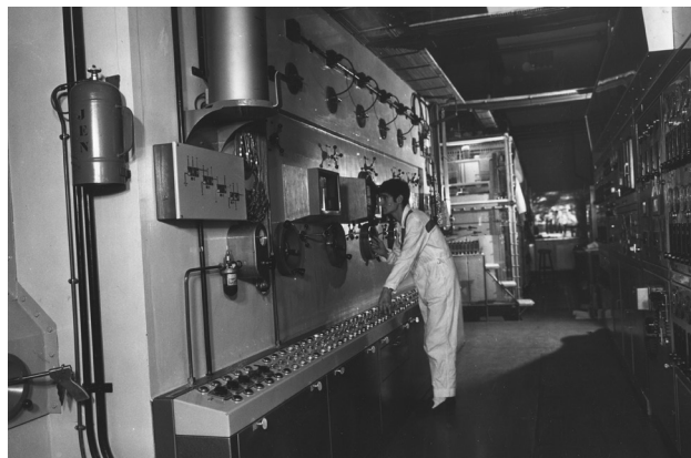
Figura 1. Celdas calientes JEN.

En todas las etapas anteriores la JEN adquirió una gran pericia, hasta el punto de fabricar los primeros elementos combustibles para la central nuclear de Vandellós I, a partir de minerales del territorio nacional y tecnologías propias de concentración de minerales, de metalurgia para la obtención de uranio metálico y de fabricación de todos los componentes del elemento combustible. Gran parte de esta experiencia se transmitió a algunos países de América latina, particularmente a Argentina.