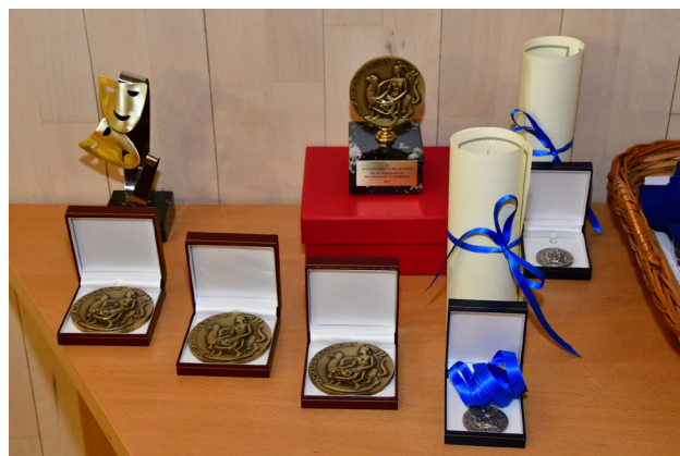
Figura 2. Medallas y reconocimientos entregados.