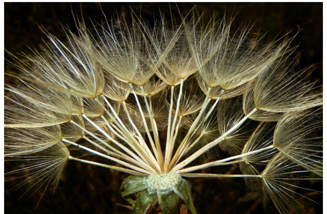
Figura 5. Segundo Premio (ex aequo) del XVII concurso de fotografía científica: “Brindis”. Autor: Julia Arroyo Carpes.