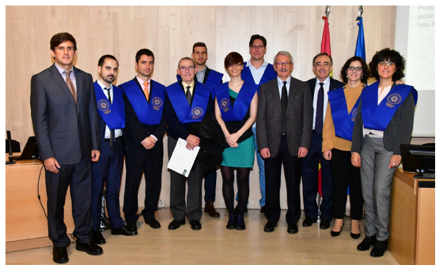
Figura 10. Egresados de la Facultad de Ciencias del curso 2016-2017.

Durante este curso han egresado de nuestra facultad 128 alumnos de grado en Ciencias Ambientales, Físicas y Matemáticas de los que acuden al acto una representa-