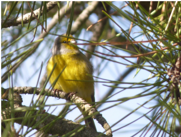
Figura 5. Verderón serrano, una de las grandes sorpresas del último censo de otoño, entre Valdevacas de Montejo y la ermita de Hornuez.