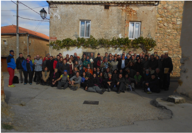
Figura 7. Participantes en el censo de otoño, en Villaverde de Montejo, el sábado 11 de noviembre de 2017.

que este rigor inspira es clave para explicar la fluidez con que se intercambia la información, bien distinta a la situación que se da en otros ámbitos, cuando algunos pretenden aprovecharse descaradamente del trabajo de los demás para su propio y exclusivo provecho”.