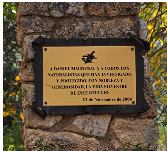
Figura 6. Placas conmemorativas. 19 de octubre de 2017).

ofrece parangón posible entre los espacios protegidos de nuestro país”. También WWF, en su revista Panda (Nº 131), señala, refiriéndose a la tarea altruista realizada, que “ gracias a este increíble trabajo las Hoces del Riaza son uno de los parajes mejor conocidos y estudiados del mundo ”.