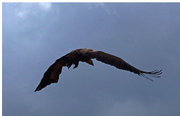
Figura 1. Buitre leonado acudiendo a un festín, en el comedero de WWF en el Refugio de Montejo. Fotografía de Dr. Juan José Bacallado Aránega (19 de octubre de 2017).

En 1974 comenzó un proyecto increíble, utópico, distinto de todos los anteriores en España. El Refugio, promovido por ADENA a instancias de Félix, se logró gracias a la generosidad y la ilusión de muchísima gente: