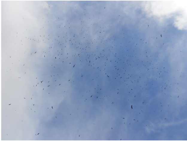
Figura 3. Al menos 558 buitres leonados, sobre el comedero del Refugio de Rapaces de Montejo. No conocemos ninguna otra foto, tomada en el Refugio, donde aparezcan tantos buitres volando. (9 de mayo de 2017). (Publicada en 2017 en la Circular 19 del Fondo para el Refugio, página 60).