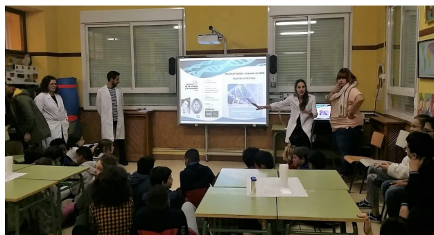
Figura 2. Captura del taller realizado en el CEIP San Cristóbal durante la explicación teórica.

Rosalind Franklin (1920-1958), doctora en Química-Física y cristalógrafa londinense fue artífice de la conocida “Fotografía 51” mediante difracción de rayos X. Dicha fotografía tomada en el 1952 dio lugar al descubrimiento de la estructura helicoidal del ADN. Desafortunadamente y debido al entorno que la rodeaba, su brillante trabajo no tuvo mayor trascendencia. Fue en el año 1962 cuando el Premio Nobel en Fisiología o Medi-