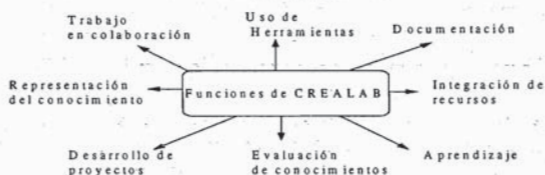
Figura 1: Actividades de CREALAB.

La base de conocimientos de CREALAB posee una estructura hipertexto y multimedia. La metodología de desarrollo hipertextual sigue un enfoque top-down, basándose en el concepto de epítome, es decir en la identificación de nodos con gran poder de síntesis conceptual, que se estructuran jerárquicamente [4]. Se ha utilizado también una aproximación orientada al objeto [5] para identificar la ontología del dominio, es decir las entidades que lo describen y sus relaciones (Figura 2), teniendo cada una de estas entidades una estructura de clase, con sus atributos y propiedades que la definen.