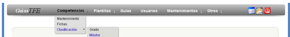
Figura 3. Imagen del menú de la aplicación para un usuario administrador

A la hora de diseñar la interfaz gráfica de la aplicación se ha seguido el criterio de homogeneidad y sencillez, de tal forma que todas las páginas tengan un aspecto simple común. En la parte superior encontramos una cabecera que nos indicará el apartado en el que nos encontramos y, en la parte derecha, se especificará el equipo activo con el que estará trabajando el usuario (este equipo podrá ser cambiado en cualquier momento sin necesidad de salir de la aplicación). Debajo de la cabecera se ubicará un menú desplegable donde el usuario escogerá las distintas acciones que podrá realizar en función de los permisos asignados (Figura 3). En esta barra de menú también aparecen algunos iconos con los que se podrán realizar otras acciones cómo: ir a los datos del usuario, subir a un nivel superior, salir de la aplicación,... Al pasar por encima de un icono veremos cuál es su función. Por debajo del menú encontramos la zona principal donde se mostrará la información solicitada por el usuario: listas de elementos, guías, informes,... En el caso de que, dentro de la sección en la que nos encontremos, el usuario pueda realizar acciones complementarias sobre los datos mostrados aparecerá un submenú lateral en la parte derecha de la pantalla con las distintas acciones adicionales. Por último, en la parte inferior de la pantalla aparecerá un pie de página con información de los autores y del tipo de licencia.