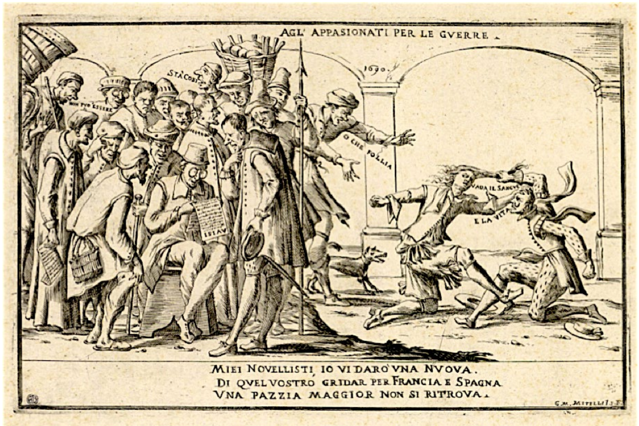
G.M. Mitelli, Agli appassionati per le guerre , aguafuerte, 1690.